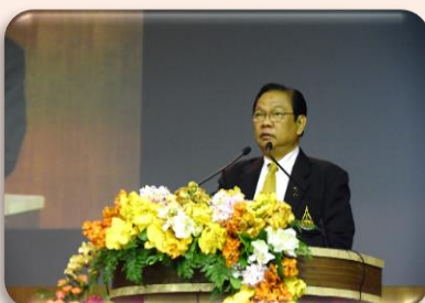
พิธีปราศรัยของท่านอธิการบดี