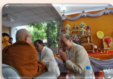
พิธีสงฆ์ / ทำบุญเลี้ยงพระ