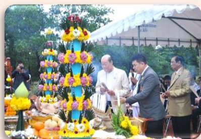
พิธีบวงสรวงท้าวสุรนารี