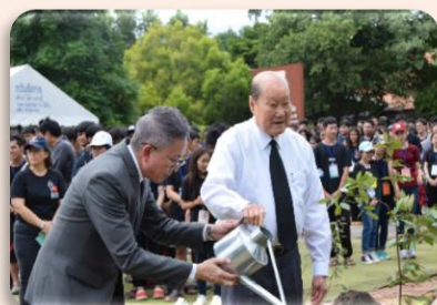
กิจกรรมปลูกต้นไม้