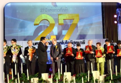
งานเลี้ยงรับรอง